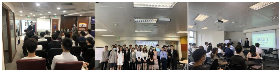
*汇丰银行实地参访