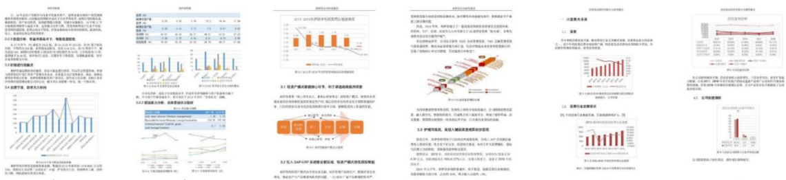
*20 级同学在大一期间独立完成的《行业研究报告》（已做模糊处理）