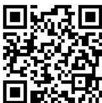
广金国际硕士预科报名二维码